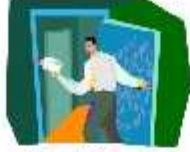
Evrak Ofise Götürülür