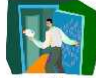
Evrak Ofise Götürülür